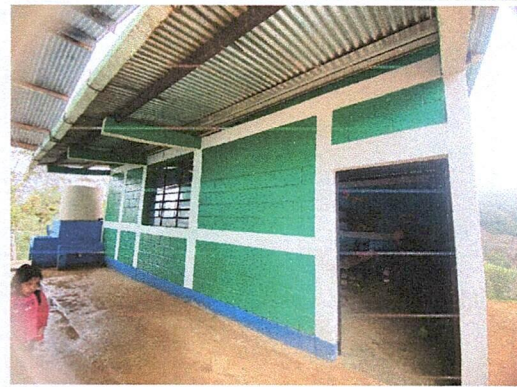
Foto 4: DE ESTA MANERA QUEDA FINALIZADA EL TRASPAJO DE PINTURA DEL ESTABLECIMIENTO

Observación: Si es necesario se pueden agregar hojas adicionales y actualizar el número de hojas.