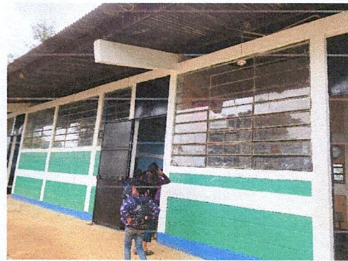
Foto 2: DE ESTA MANERA A QUEDADO FINALIZADA LA PINTURA DEL ESTABLECIMIENTO