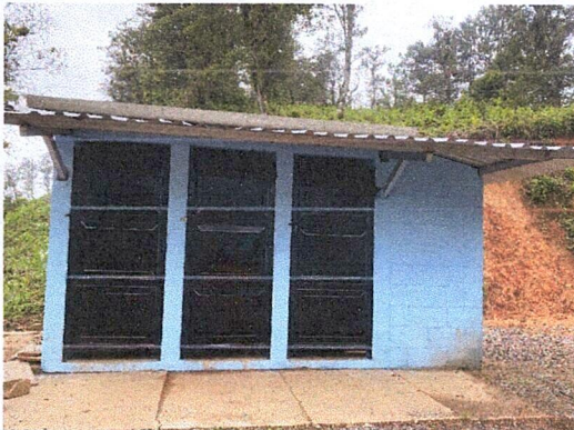
Foto 3: ESTA IMAGEN MUESTRA LA REMODEACION DE LOS SERVICIOS SANITARIOS